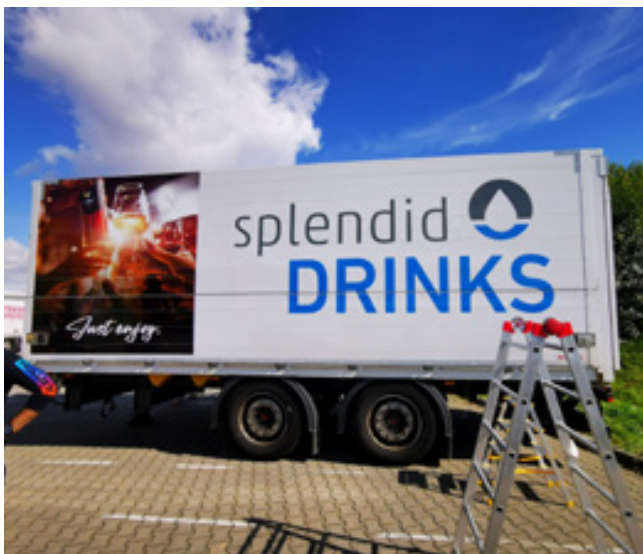
LKW-Folierung, Flottenbeklebung, Splendid Drinks GmbH