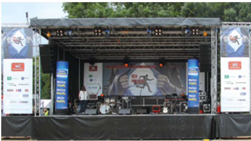
Bühnenbanner und Backdrop aus Textil, Firmenlauf Chemnitz