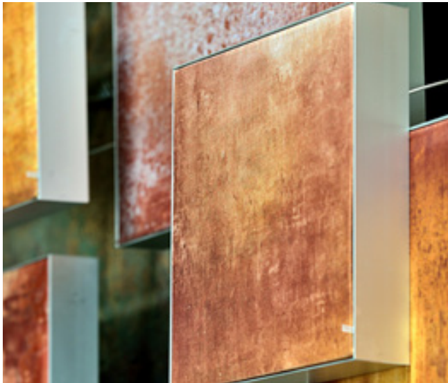
Designobjekte mit akustischer Wirkung, Kraftverkehr Chemnitz