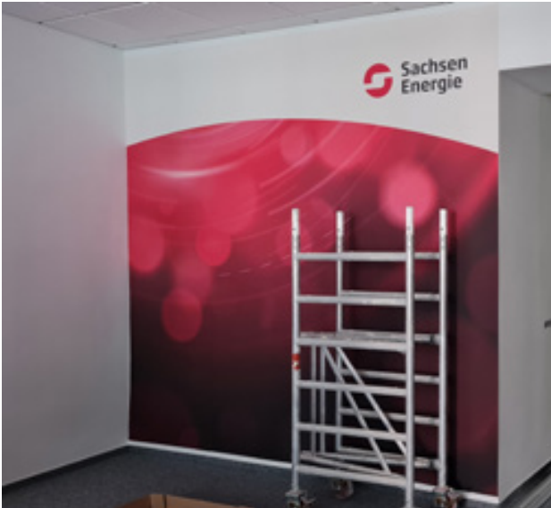
Vliestapete, Sachsen Energie