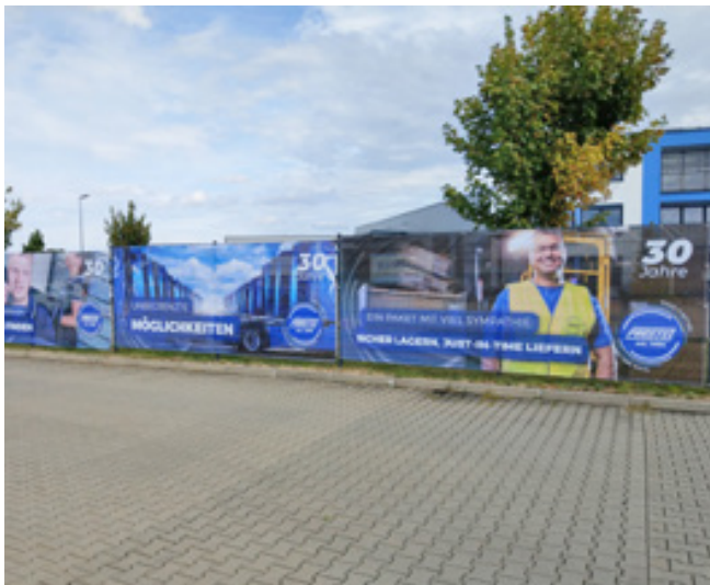
Zaunbanner, Prüstel Spedition GmbH