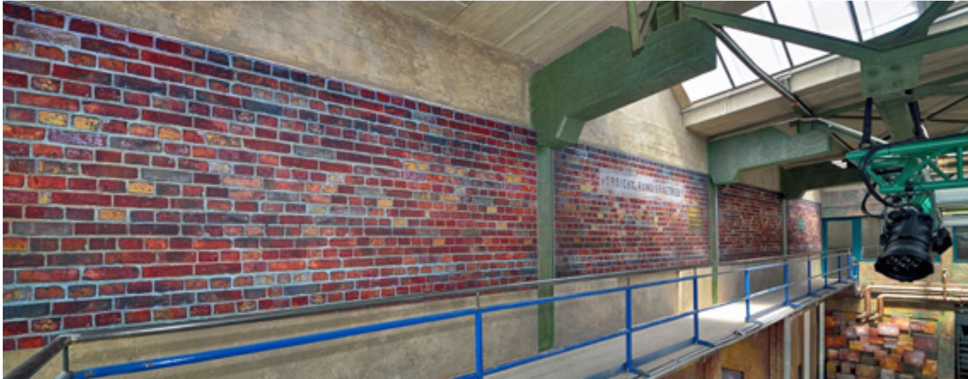
Wandverkleidung, Kraftverkehr Chemnitz

Zur Verschönerung von Räumen bedrucken wir Textilien von der Rolle bis zu einer Breite von 3,20 m. Und sollte das nicht ausreichen, konfektionieren wir mehrere Bahnen zu einer Fläche, die passend für Ihren Raum ist. Selbstverständlich ist für uns, Sie entlang der Wertschöpfungskette zu begleiten. Von der Idee, über die Gestaltung bis hin zur fachgerechten Montage.