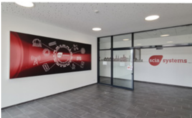
Textilspannrahmen mit Hinterleuchtung, Scia