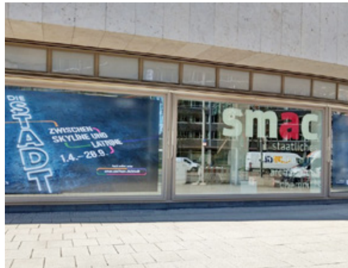
Schaufensterbeklebung, SMAC Chemnitz