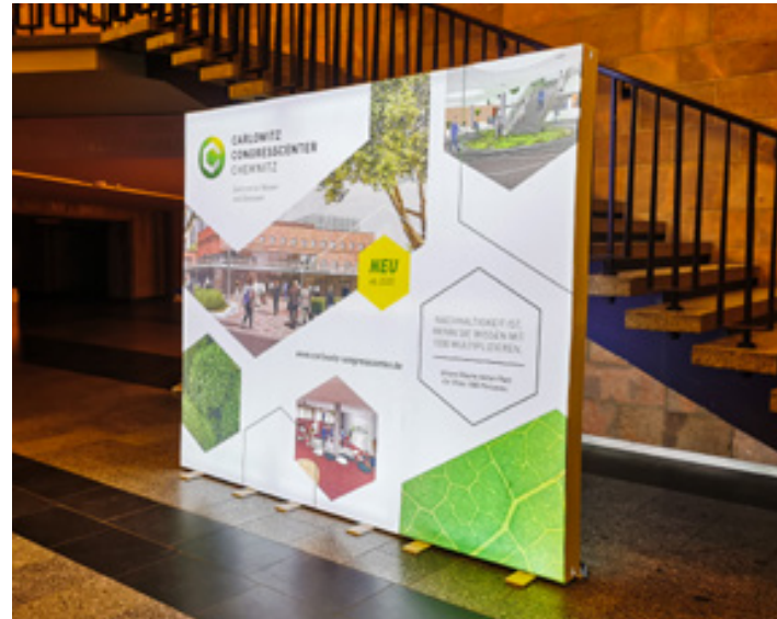
Präsentationssystem PixLip Leuchtwand, C3