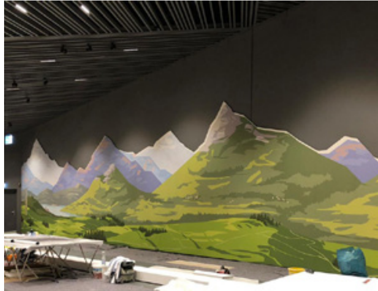
Konturgeschnittene Vliestapeten, Museum der Bayerischen Geschichte