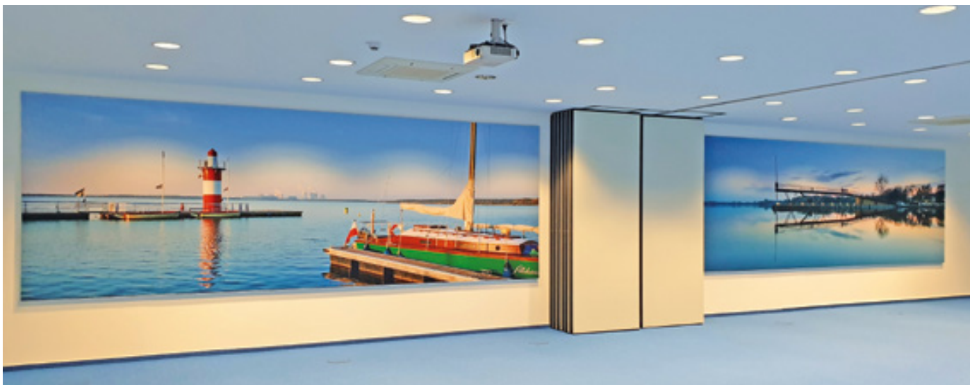
Akustikbilder, LEAG Energiekraftwerk AG, i. A. der Büroland GmbH

Akustikbilder sind kostengünstige und attraktive Raumwunder. Kleinste Räume bis große Hallen werden optisch und akustisch hochwertig ausgestattet. Die individuellen, schallmindernden Wandbilder, Raumteiler oder Wandverkleidungen sind perfekte Werbeträger oder einzigartige Accessoires zur Verbesserung der Raumakustik.