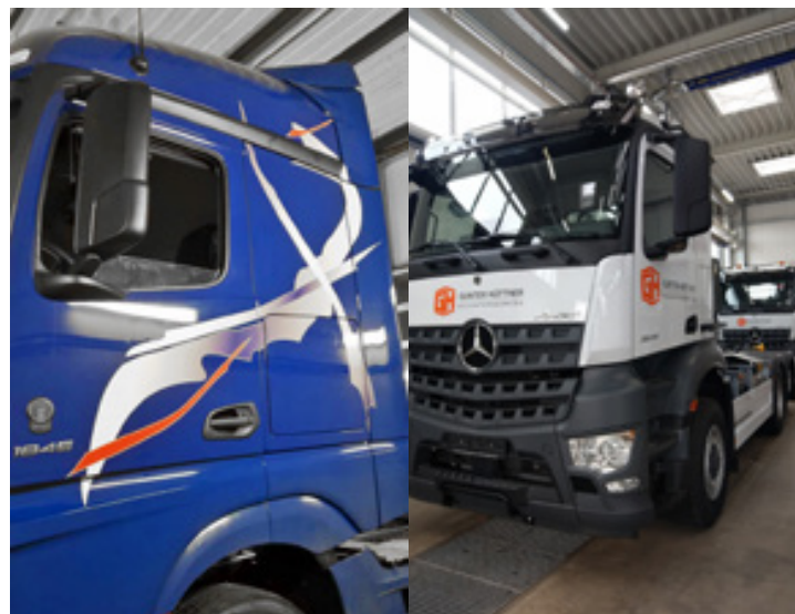
Teilfolierung von Fahrerhäusern der Firmen Prüstel und Gunter Hüttner