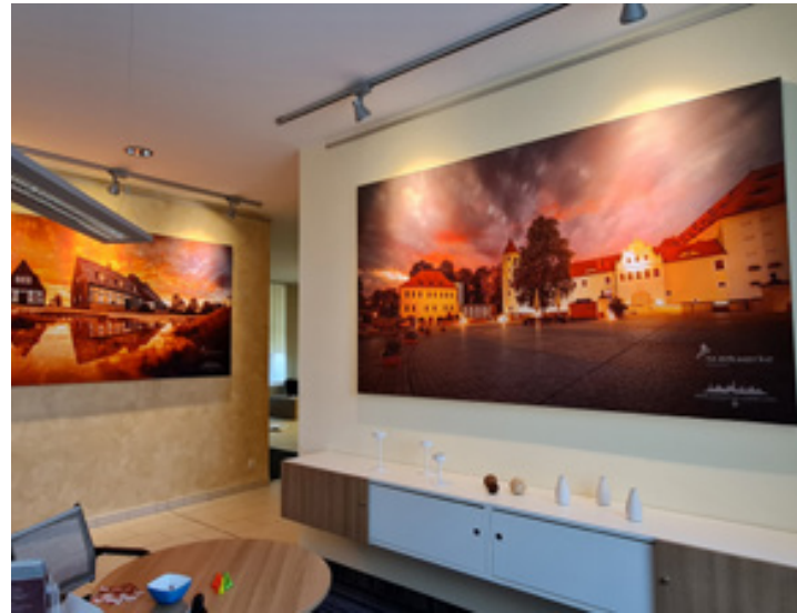
Akustikbilder, Stadtwerke Freiberg