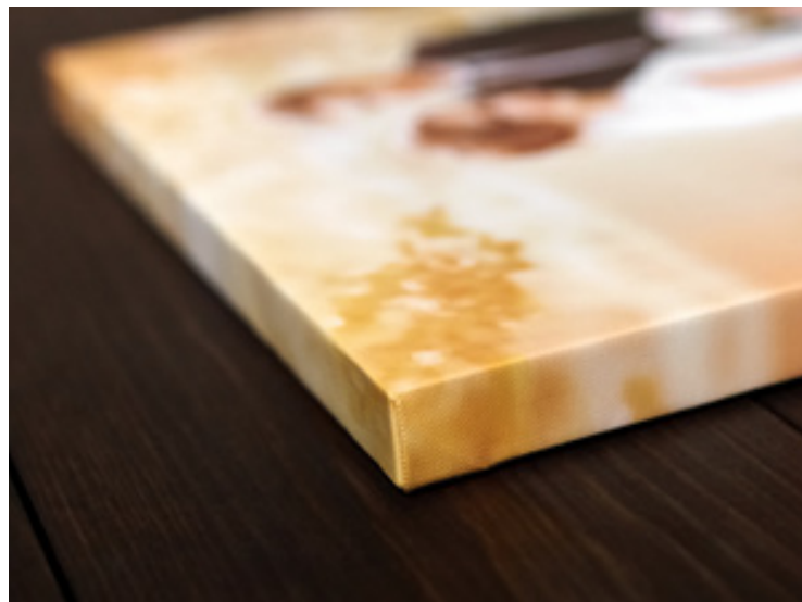
Fertigung von Bildern auf Canvas-Gewebe und Keilholzrahmen in allen Größen