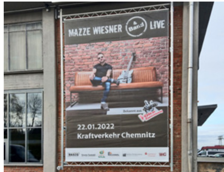
KRAFTVERKEHR - Event- und Kongresskultur