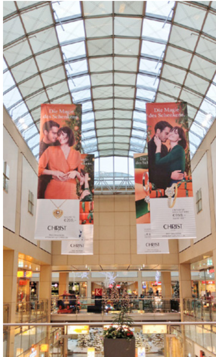
Indoorbanner an Seilsystemen, Altmarkt Galerie Dresden