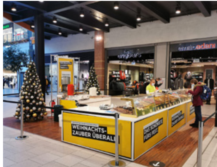
Dekoration und Standbau, Sachsen-Allee Cehmnitz