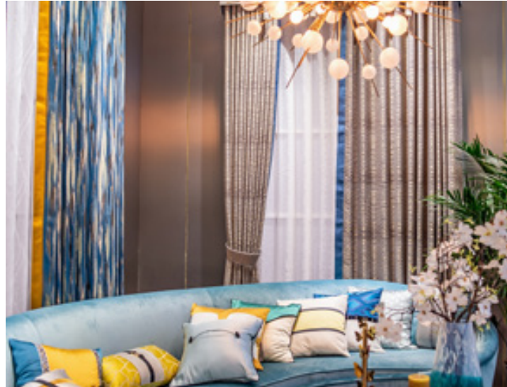
Kissen mit individuellen Motiven