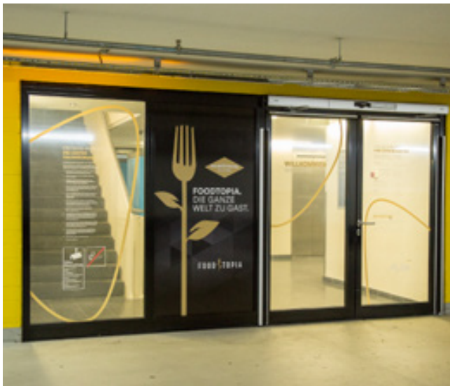
Türenbeschriftung, MyZeil Frankfurt