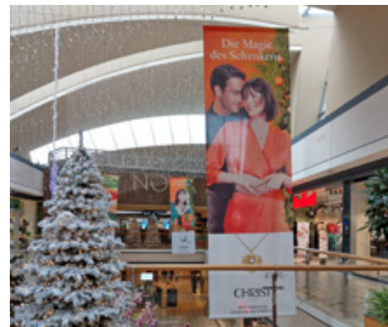
Doppelseitige Textil-Indoorbanner, Nova Eventis Leipzig