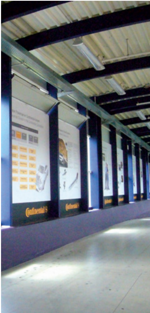
Informationstafeln, Continental AG Limbach-Oberfrohna

Beratungshotline: 0371 355799-0 Datentransfer: daten@baseg.de