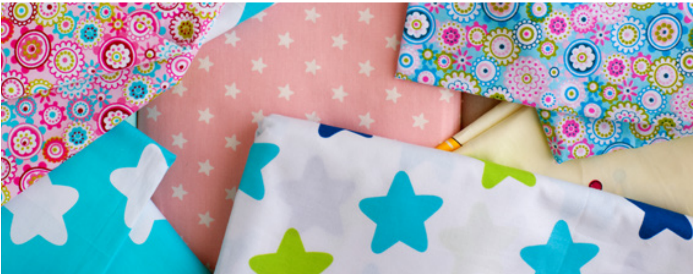
Ihr Motiv, Ihr Muster auf fast jedem Stoff.