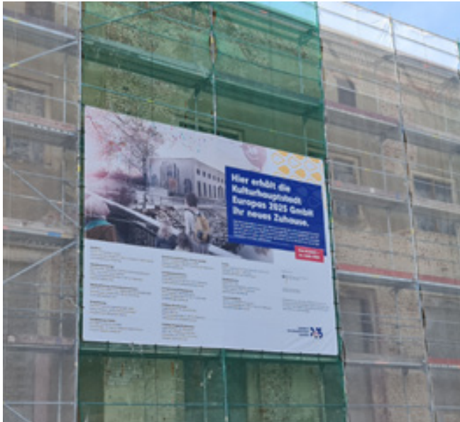
Bauplane HartmannFabrik, Steinert Ingenieuresellschaft

Beratungshotline: 0371 355799-0 Datentransfer: daten@baseg.de