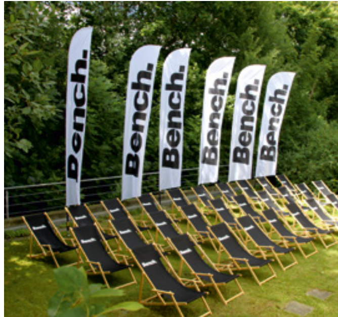
Beachflags und Liegestühle, Bench