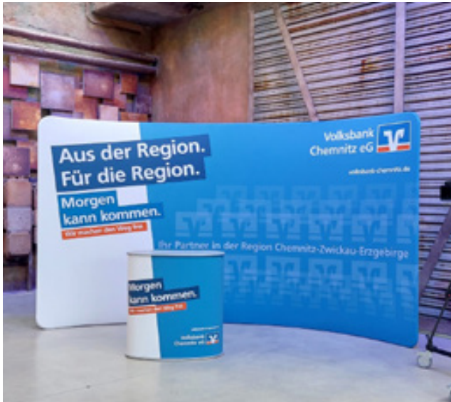
Zipperwall, Volksbank Chemnitz

Beratungshotline: 0371 355799-0 Datentransfer: daten@baseg.de