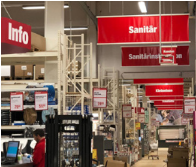
Gangbeschilderung und Infosysteme, Hellweg Baumärkte