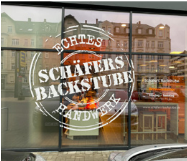
Fensterverklebung, Schäfers Backstube