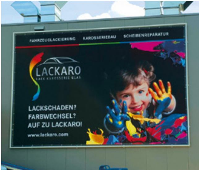
Montage von Spannrahmen für Fassadenbanner, Lackaro GmbH i.A. der Werbeagentur Fortuna GmbH

Für Kunden sichtbar sein und Orientierung bieten – dafür machen wir Ihr Unternehmen fit. Wir montieren die gesamte Palette der Außenwerbung am Gebäude, auf Glas oder als freistehenden Werbeträger, beleuchtet oder unbeleuchtet. Ganz nach Ihren Vorstellungen. Dabei steht an erster Stelle kompetente Beratung.