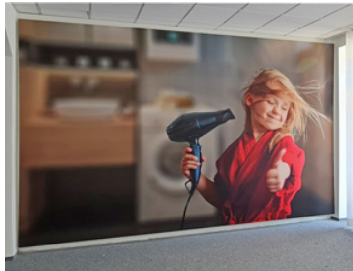
Textilspannrahmen über komplette Wandfläche, Kontek