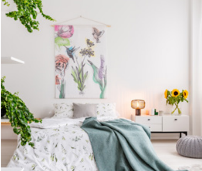
Bezüge und Decken, passend zur Einrichtung