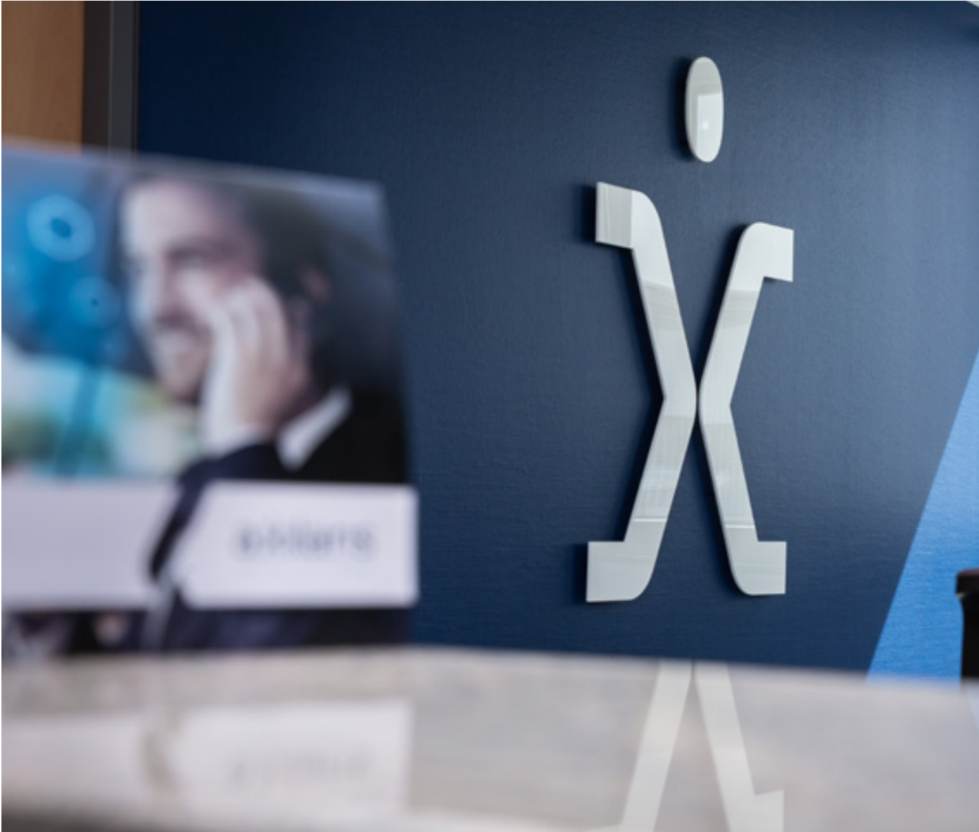
Gestaltung von Empfang und Flur, axilaris GmbH