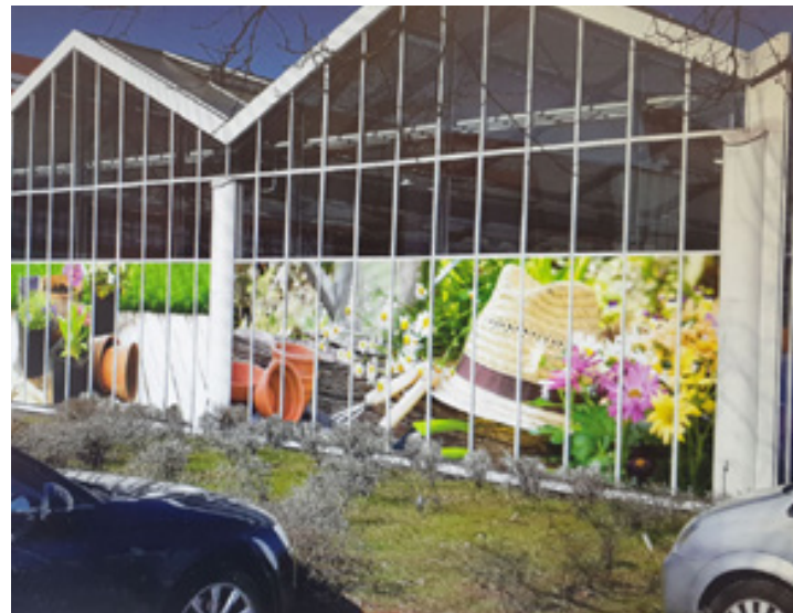
Folierung von Fensterflächen, Helliweg Baumärkte