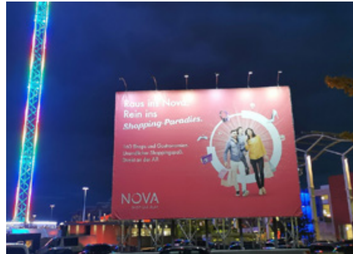
Frontlitbanner, Nova Eventis Leipzig