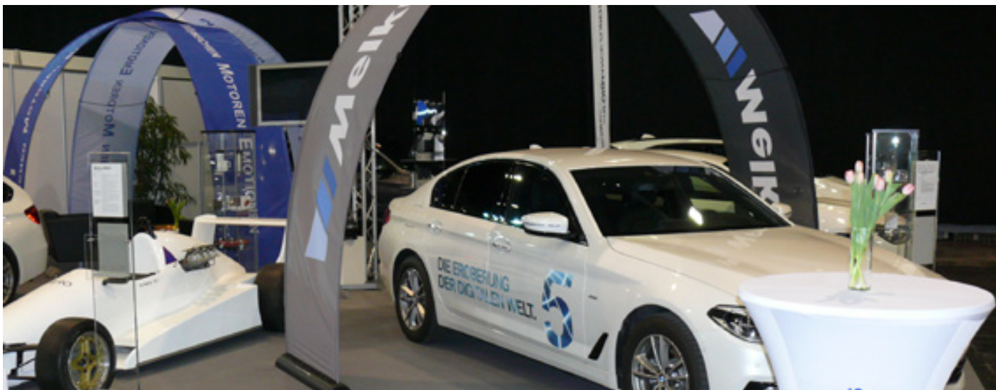
Bannerbow als Kundenstopper und Besprechungsinsel, Autohaus Melkus