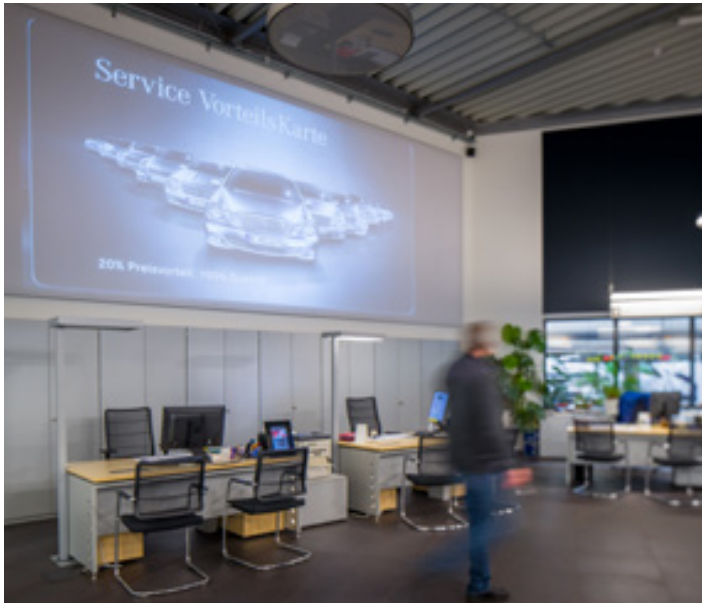
Projektionswand, Serviceannahme Schloz Wöllenstein GmbH & Co. KG