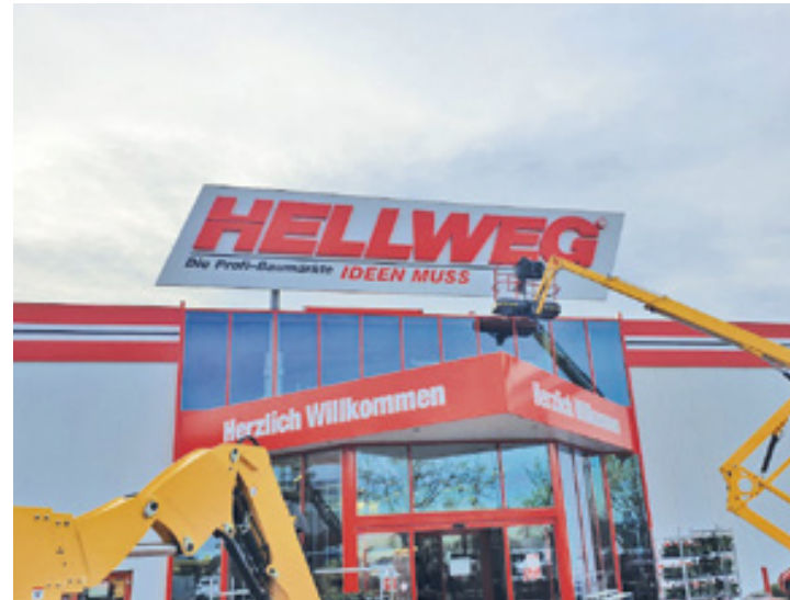
Montage Markenschriftzug, Hellweg Baumärkte