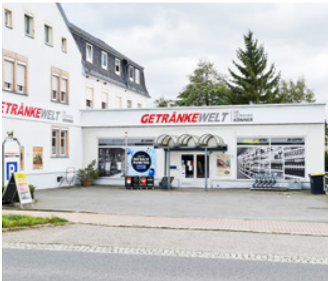
Standortbeschilderung, Fassadenbeschilderung, Getränkewelt GmbH