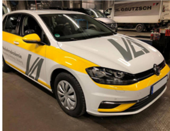
Fahrzeugfolierung, Verkehrsinstitut Chemnitz GmbH