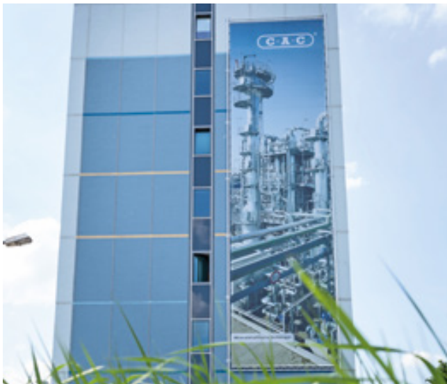
Chemieanlagenbau Chemnitz GmbH