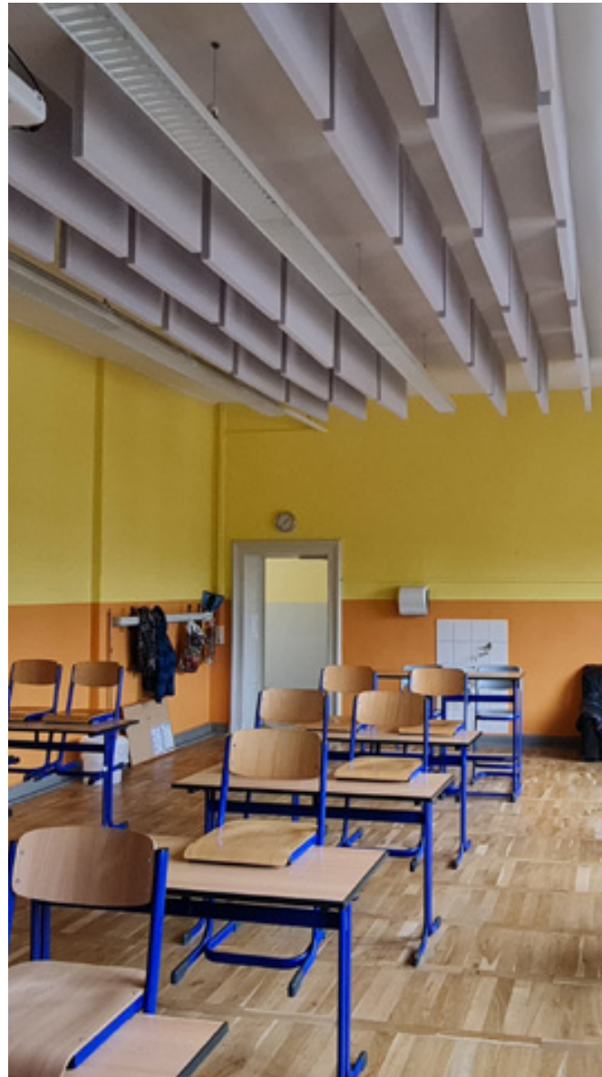
Baffeldecke, Gymnasium Penig