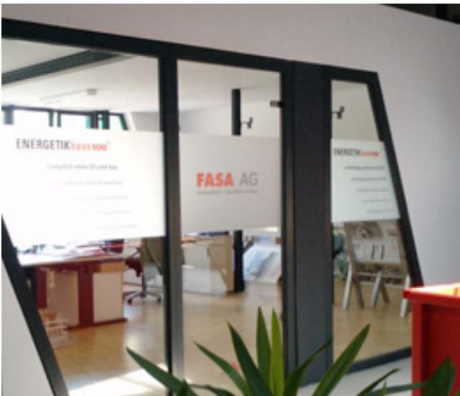
Bedruckte Glasdekorfolie, FASA AG