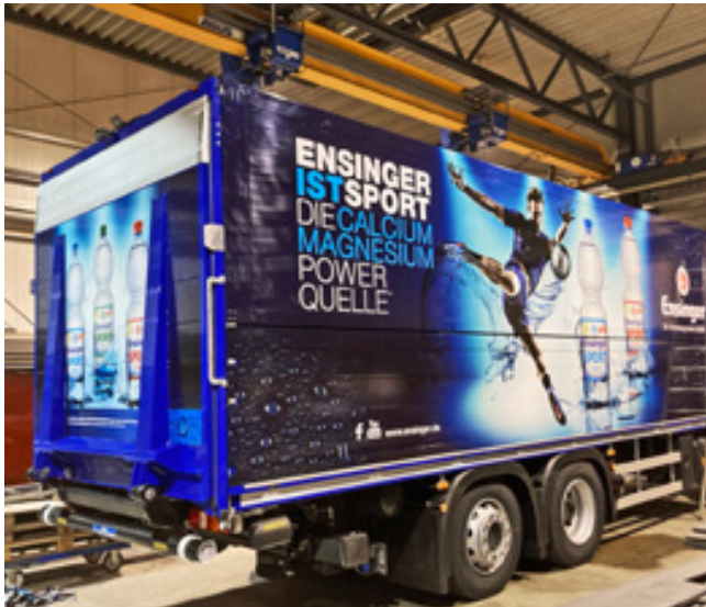
Vollfolierung von LKW-Anhängern der Firma Ensinger