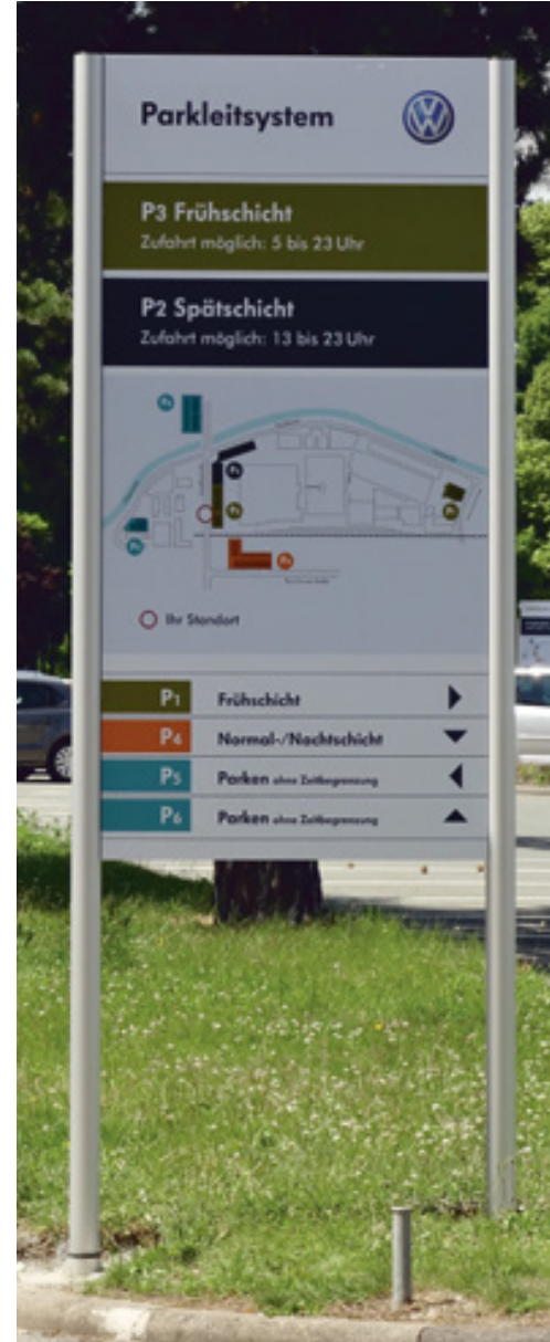
Parkleitsystem, VW Sachsen Motorenwerk Chemnitz