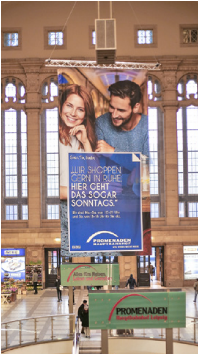
Blockout Banner, Promenaden Hauptbahnhof Leipzig

Damit Ihre Banner richtig hängen, bieten wir auf Wunsch den kompletten Service bis zur Montage. Keine Wand ist uns zu groß. Keine Decke zu hoch. Keine Fassade zu kompliziert. Unsere Werbetechniker finden das perfekte Befestigungssystem und montieren alles in Windeseile.