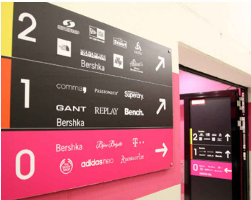
Orientierungssystem, MyZeil Frankfurt a. M.