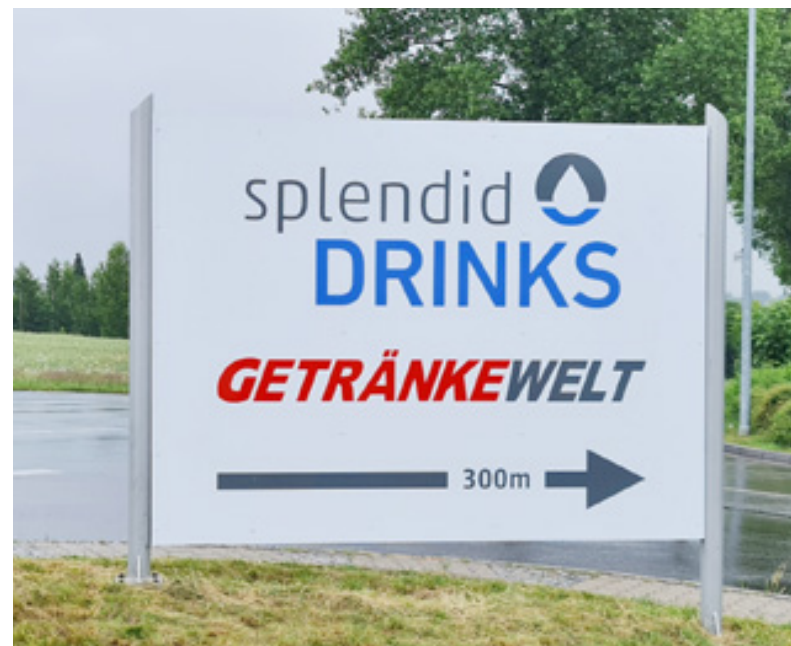
Firmenbeschilderung, Splendid Drinks GmbH