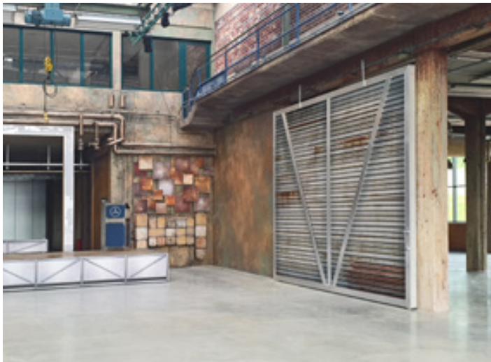
Wandverkleidung, Schiebetore und Designelemente, Kraftverkehr Chemnitz