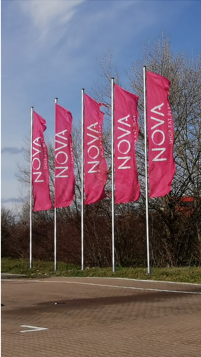
Hissfahnen, Nova Enventis Leipzig

Mit Fahnen und Beachflags bleiben Ihre Botschaften in Bewegung. Wir fertigen Ihre Ideen für Sie ganz individuell: einfach aufzustellende Beachflags als Kundenstopper oder Fahnen für einen dauerhaft wehenden Einsatz. Lenken Sie die Aufmerksamkeit in Fußgängerzonen, auf Messen, Events oder an Ihrem Firmensitz auf sich!