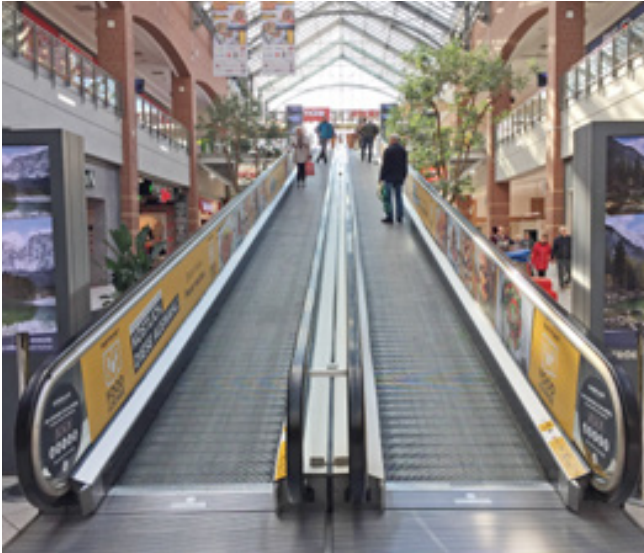
Doppelseitige Beklebung der Rolltreppe, Sachsen-Allee Chemnitz