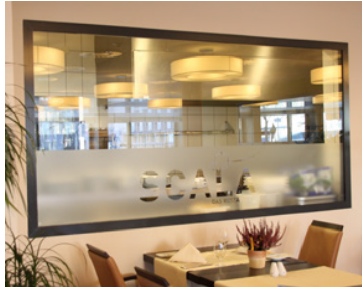
Glasdekorfolie, Hotel an der Oper