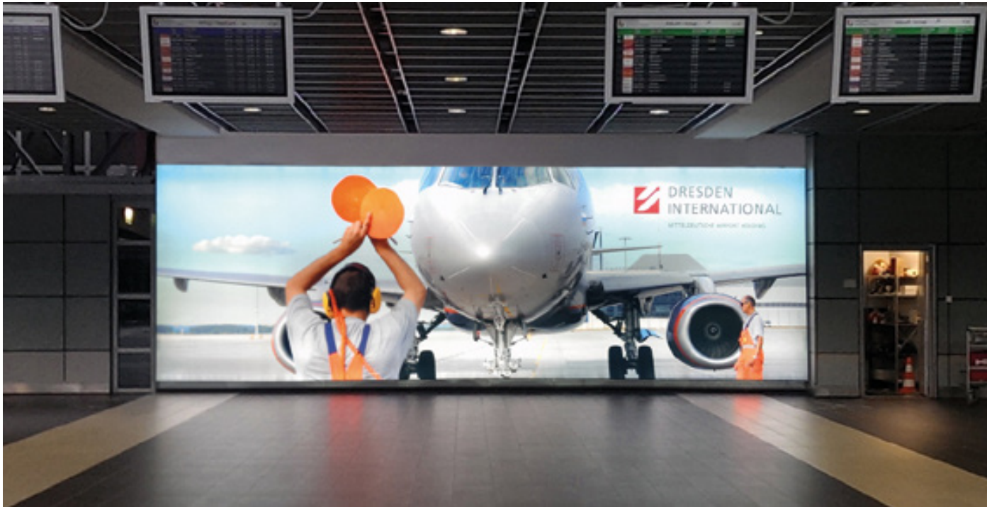
Textilspannrahmen mit Hinterleuchtung 9 x 3 m, Flughafen Dresden i. A. der Büroland GmbH

Design trifft Funktion: Die neuen ILUMAG-Bilder mit wechselbaren Motiven verleihen Ihren Räumen eine besondere Note.