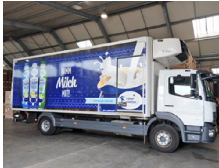
Vollfolierung LKW-Koffer, Kohrener Land