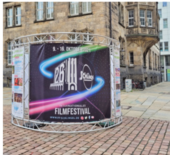
Frontlitbanner, Sächsischer Kinder- und Jugendfilmdienst e.V.