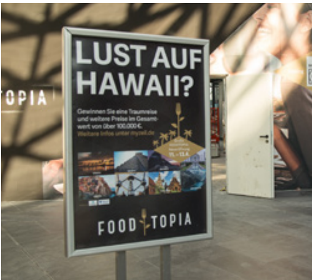
Plakate, Poster und Keilrahmen sind preisgünstige Werbeträger.