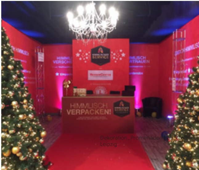
Verkleidung eines temporären Promotionstandes, Hessen-Center

Mit innovativen Systemlösungen und großformatigen Textildrucken zaubern wir im Handumdrehen individuelle Eyecatcher zur Verkaufsförderung. Mit eingehender Beratung zur technischen Umsetzung über die Produktion der Materialien im eigenen Haus bis zur Montage vor Ort realisieren unsere Spezialisten (fast) jedes Projekt.