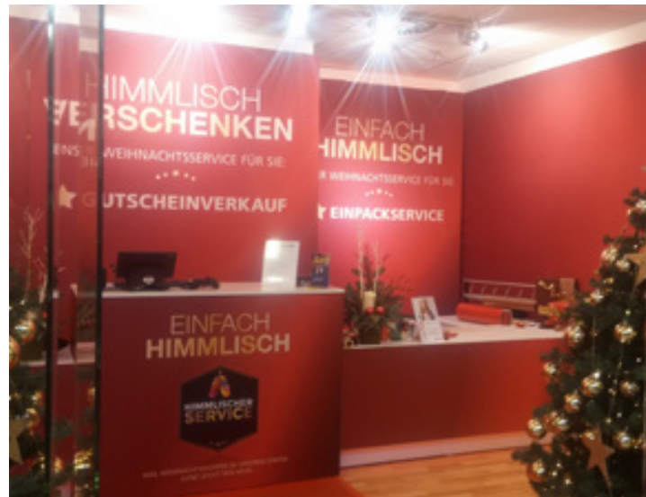
Dekoration und Ladenbau, Zwickau Arcaden