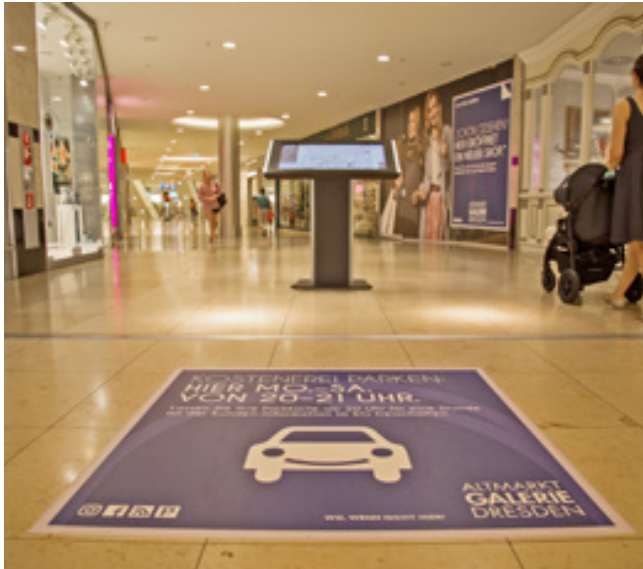
Fußbodenaufkleber, Altmarkt Galerie Dresden

Blasenfreie Werbung auf Schritt und Tritt: Unsere Klebefolien werden durch uns professionell auf Fußböden, Türen, Fenstern oder Shopfronten angebracht. Auch großflächig sorgt unsere Beklebung für ein perfektes Bild ohne Lufteinschlüsse. Dauerhaft oder temporär – fachgerechtes Bekleben zahlt sich aus!