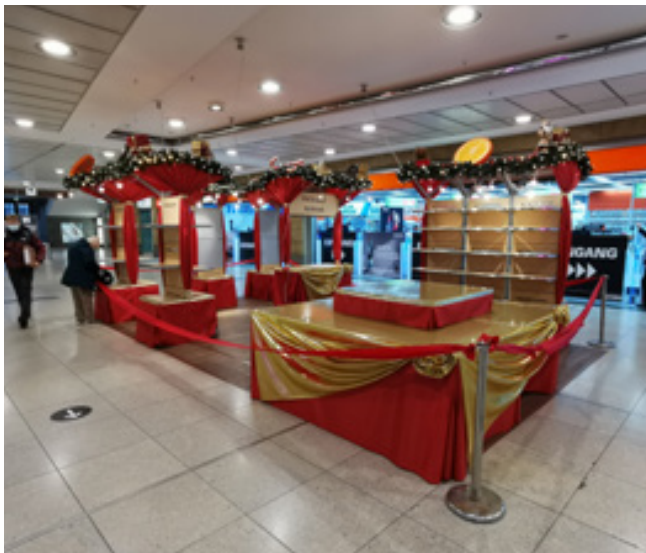
Dekoration, Promenaden Hauptbahnhof Leipzig