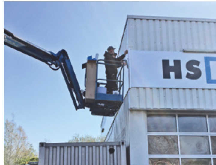
Überklebung vorhandener Firmenschilder aus Aludibond, HSR GmbH