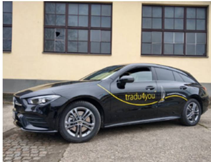
tradu4you, PKW-Folierung, Folieplot