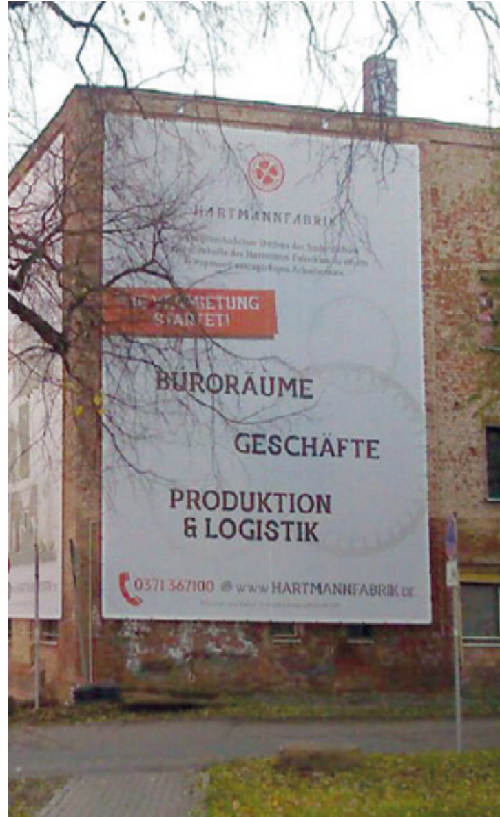
Fassadenbanner, Hartmannfabrik i. A. der zebra | group