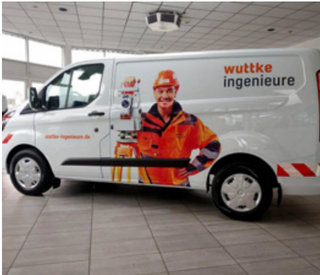
Teilfolierung, Wuttke Ingenieure