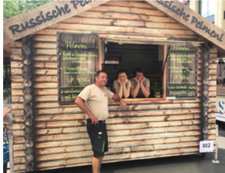
Gestaltung und Beklebung mobiler Verkaufsstand, Gastro Fuchs Leipzig