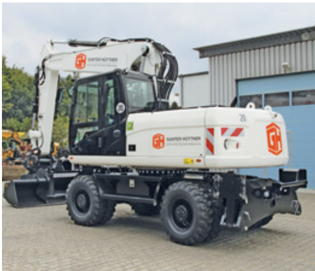
Flottenmanagement, Gunter Hüttner + Co. GmbH