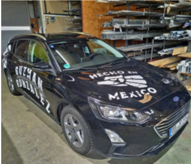
Fahrzeugfolierung, Mexican Soda Company GmbH & Co. KG