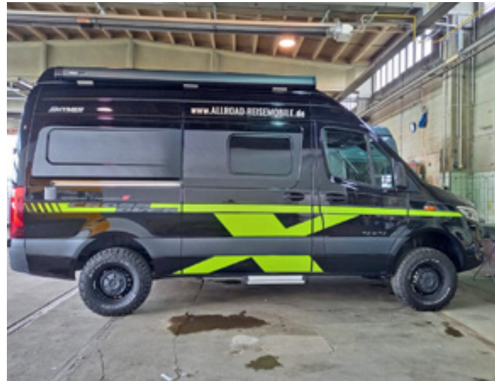
Teilfolierung, Allroad Reisemobile Chemnitz GmbH