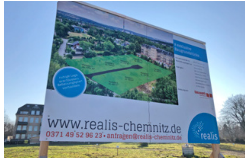
Bauschild, Realis Chemnitz